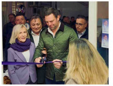
Ιδιαίτερη αναφορά έκανε ο κ. Κασσελάκης στους ανθρωπίνους του Κινήματος, δηλώνοντας πως είναι «πραγματικό υπερήφανο» για τα μέλη του. Όπως σημείωσε, πρόκειται για «ήμιους δημοκρατικούς πολίτες, που δεν αναζητούν ρασιδικία αλλά αλληλεγγύη», υπογραμμίζοντας ότι η Δημοκρατία «χτίζεται από τις γενναίες και όχι από τα ασύλλητα των επιχειρηματιών και των βο-

Ο πρόεδρος του Κινήματος ευχαρίστησε τη γραμματεία της τοπικής Οργάνωσης για τη δράση της, καθώς και τη Βουλευτική Βουλευτή Γιώτα Πούλου για τη στήριξη της. Στο εγκίνια παραβρέθηκαν επίσης η διαβήτορας του γραφείου του και βουλευτής του Νοτίου Τομέα Αθηνών,