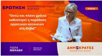
ΕΡΩΤΗΣΗ ΚΟΙΝΟΒΟΥΛΕΥΤΙΚΟΥ ΕΛΕΓΧΟΥ "Οκτώ και πλέον χρόνια καθυστερεί η παράδοση εργατικών κατοικιών στη Θήβα"