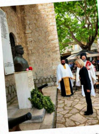
προσέλευσης στα Ιδανικά της Ελευθερίας και της Δημοκρατίας. Η διατήρηση της ιστορικής μνήμης αποτελεί ελάχιστο φόρο τιμής προς όλους εκείνους που αγωνίστηκαν και θυσιάστηκαν για την Ανεξαρτησία, τη λήξη κυριαρχία και την ανθρωπινή Αξιοπρέπεια. Στεκόμαστε απέναντι σε κάθε μορφή φανατισμού, αυταρχισμού και μισαλλοδοξίας, και δεσμευόμαστε έναν κόσμο Ειρήνης, Δικαιοσύνης και Αλληλεγγύης μετόυ των λαών, την

μνήμης αποτελεί ελάχιστο φόρο τιμής προς όλους εκείνους που αγωνίστηκαν και θυσιάστηκαν για την Ανεξαρτησία, τη λήξη κυριαρχία και την ανθρωπινή Αξιοπρέπεια. Στεκόμαστε απέναντι σε κάθε μορφή φανατισμού, αυταρχισμού και μισαλλοδοξίας, και δεσμευόμαστε έναν κόσμο Ειρήνης, Δικαιοσύνης και Αλληλεγγύης μετόυ των λαών, την