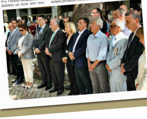
προσέλευσης στα Ιδανικά της Ελευθερίας και της Δημοκρατίας. Η διατήρηση της ιστορικής μνήμης αποτελεί ελάχιστο φόρο τιμής προς όλους εκείνους που αγωνίστηκαν και θυσιάστηκαν για την Ανεξαρτησία, τη λήξη κυριαρχία και την ανθρωπινή Αξιοπρέπεια. Στεκόμαστε απέναντι σε κάθε μορφή φανατισμού, αυταρχισμού και μισαλλοδοξίας, και δεσμευόμαστε έναν κόσμο Ειρήνης, Δικαιοσύνης και Αλληλεγγύης μετόυ των λαών, την