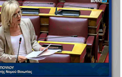
ΠΑΝΑΓΙΟΥ (ΓΙΩΤΑ) ΠΟΥΛΟΥ, Ανεξάρτητη Βουλευτής Νομού Βοιωτίας

Προς τον κ. Υπουργό Αγροτικής Ανάπτυξης & Τροφίμων ΘΕΜΑ: Άδικος αποκλεισμός καλλιεργητών μηδικής της ΠΕ Βοιωτίας από τις κρατικές ενισχύσεις ήσσονος σημασίας de minimis... Η κυβερνητική οδοντία αντιμετωπίζει και εξοδίζει της ευλογίας οδηγίες πολλών κλάδους της αγροτικής οικονομίας σε οικονομική δυσχέρεια... Πέραν από τις άμεσες επιπτώσεις στην κτηνοτροφική παραγωγή έχει επηρεαστεί επίσης σε πολύ μεγάλο